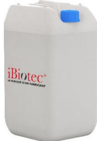
Bidon 20 L