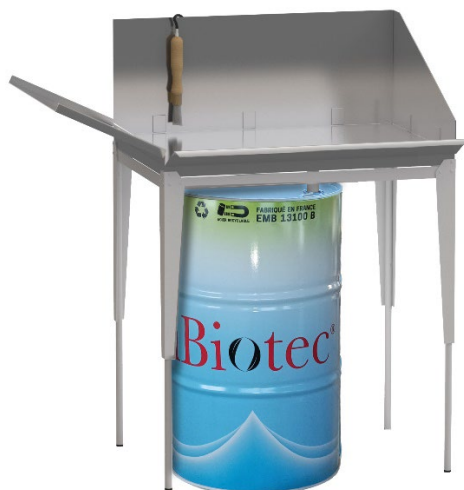
Fontaines à solvants

iBiotec® Tec Industries® Service Z.I La Massane - 13210 Saint-Rémy de Provence – France Tél. +33(0)4 90 92 74 70 – Fax. +33 (0)4 90 92 32 32 www.ibiotec.fr