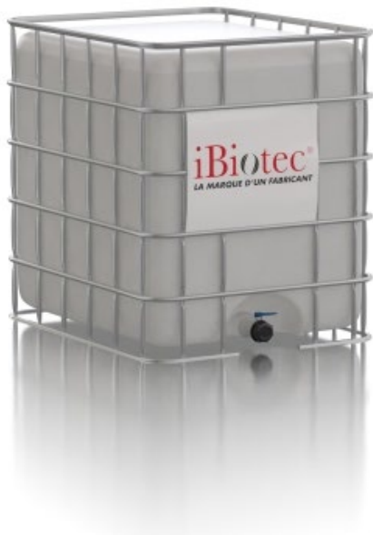
Container GRV 1000 L